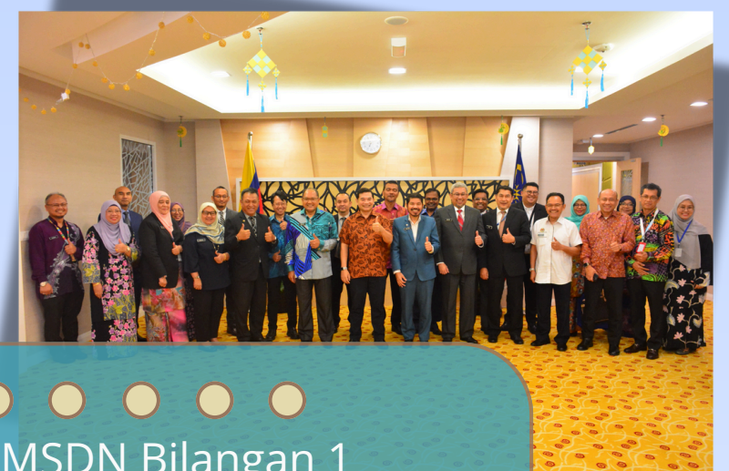
Mesyuarat JKE MSDN Bilangan 1 Tahun 2023 telah dilaksanakan pada 18 Mei 2023 yang dipengerusikan oleh YB Menteri Ekonomi, Dato' Seri Mohd Rafizi Ramli