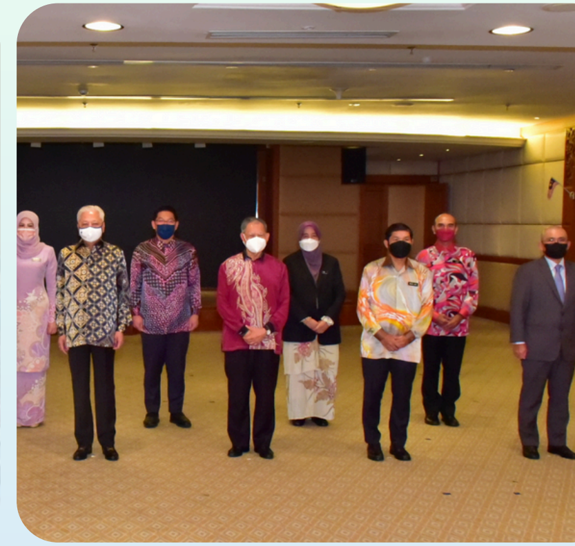
Mesyuarat Tertinggi MSDN Bilangan 1 Tahun 2022 telah dilaksanakan pada 27 Januari 2022 dipengerusi oleh Perdana Menteri Malaysia, YAB Dato' Sri Ismail Sabri Yaakob