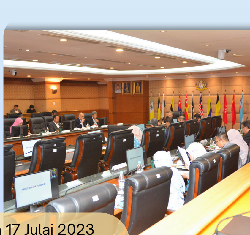
Mesyuarat Tertinggi MSDN Bilangan 1 Tahun 2023 telah dilaksanakan pada 17 Julai 2023 dipengerusi oleh Timbalan Perdana Menteri II dan Menteri Perladangan dan Komoditi, YAB Dato' Sri Haji Fadillah Haji Yusof