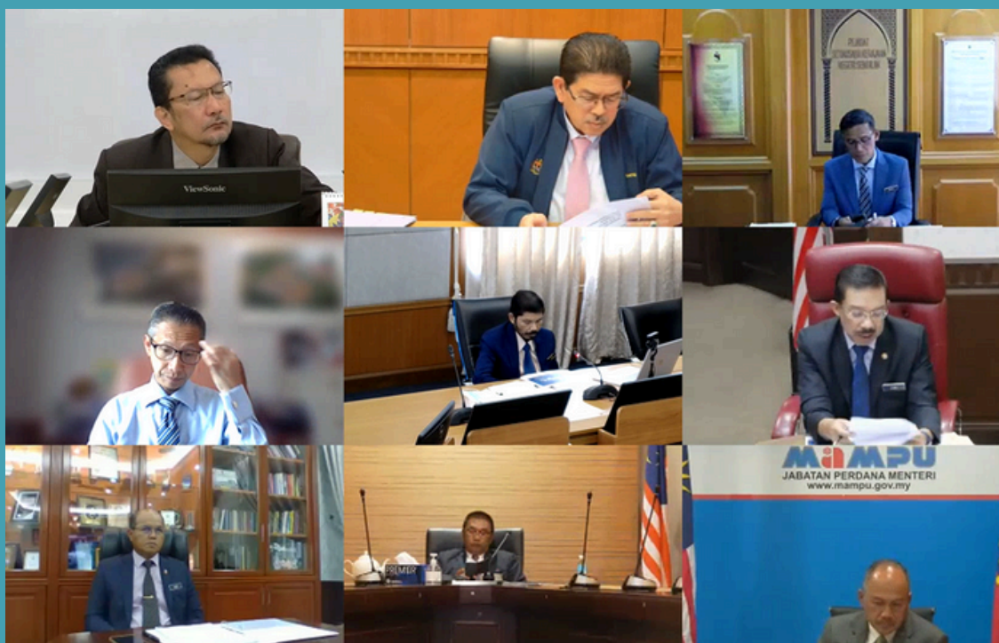
Mesyuarat JKE MSDN Bilangan 1 Tahun 2022 telah dilaksanakan pada 5 September 2022 dipengerusikan oleh Ketua Setiausaha Negara, Tan Sri Mohd Zuki Ali secara atas talian